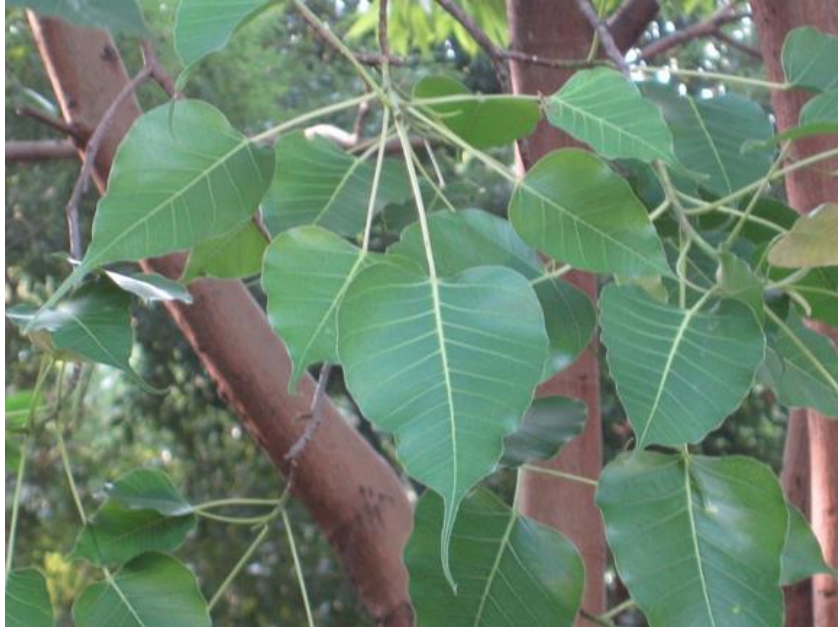
Hình 5: Phân biệt với Đa Bồ đề - đầu lá nhọn dài hơn