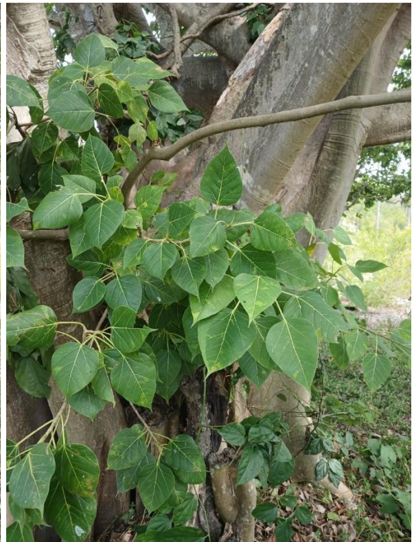
Hình 1,2,3,4: Đa lâm vồ – Thân cây & cành lá