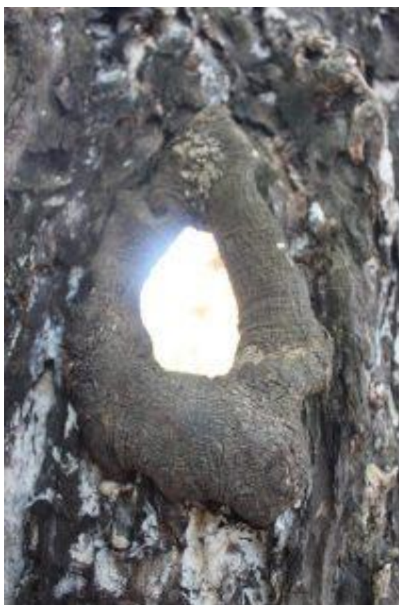
Hình 3: Cây Thị ở Tháp Bà có lỗ to ở giữa thân