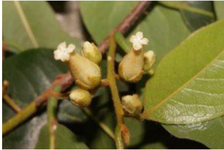
Hình 4: Thị – hoa