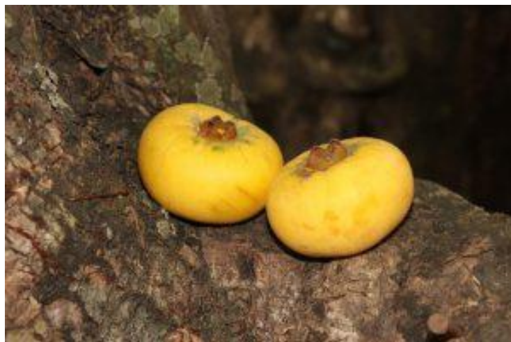
Hình 6: Thị – quả lép (không hạt)