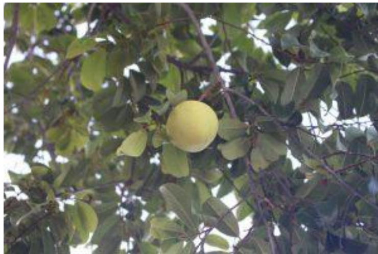
Hình 5: Thị – quả