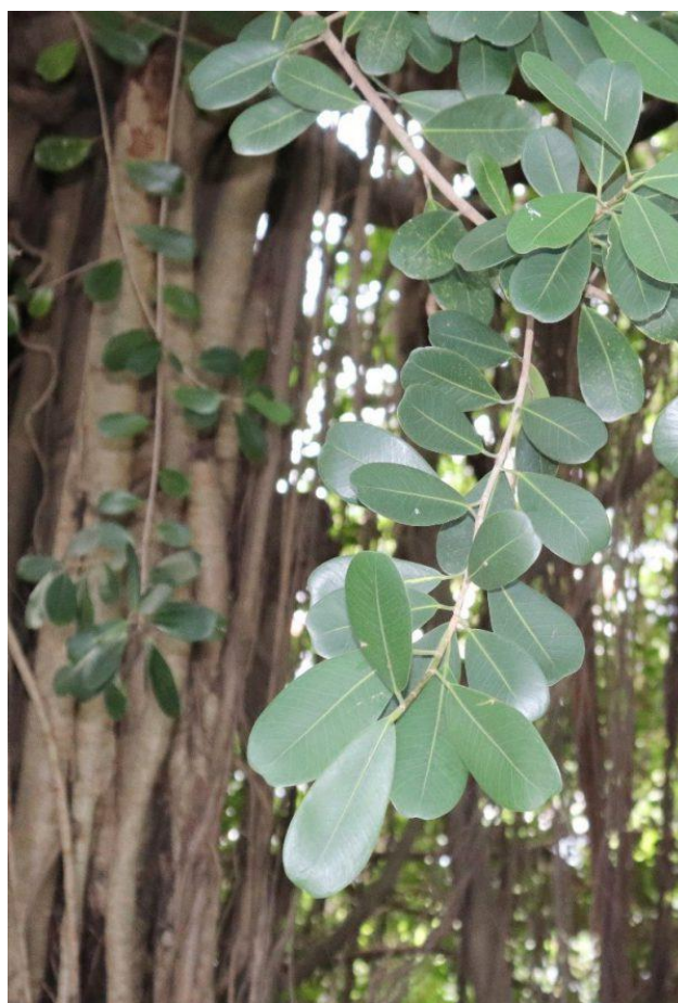
Hình 2: Đa quả vàng – nhiều rễ thòng và cành nhánh