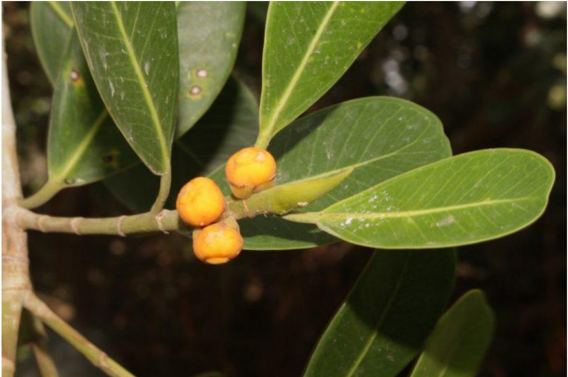
Hình 3: Đa quả vàng – cành lá, lá kèm & quả màu vàng