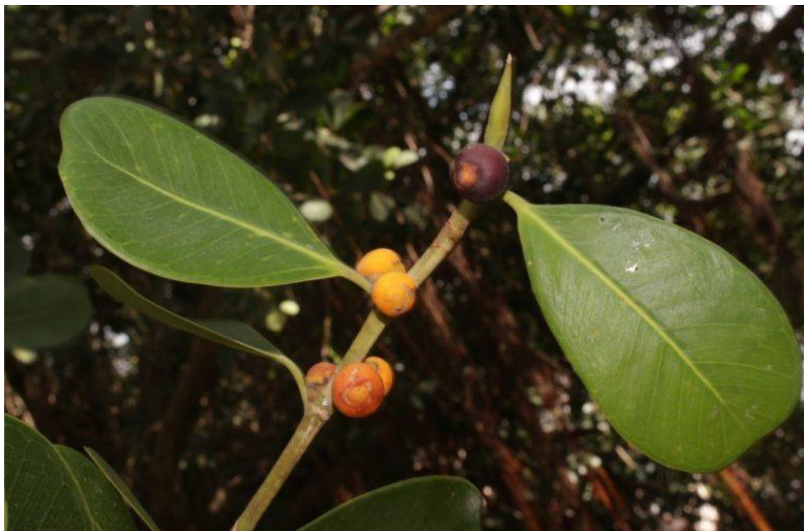
Hình 4: Đa quả vàng – quả chín màu đỏ tím