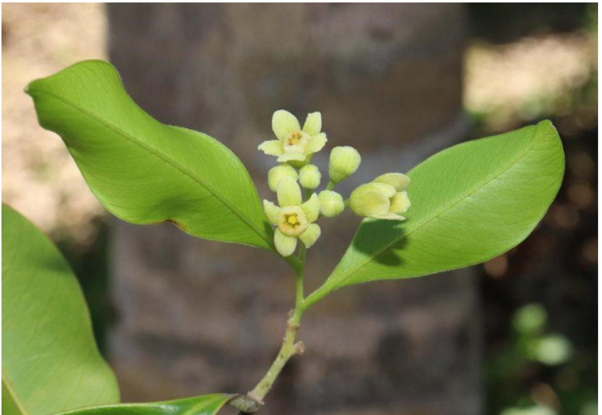
Hình 3: Dó bầu – hoa