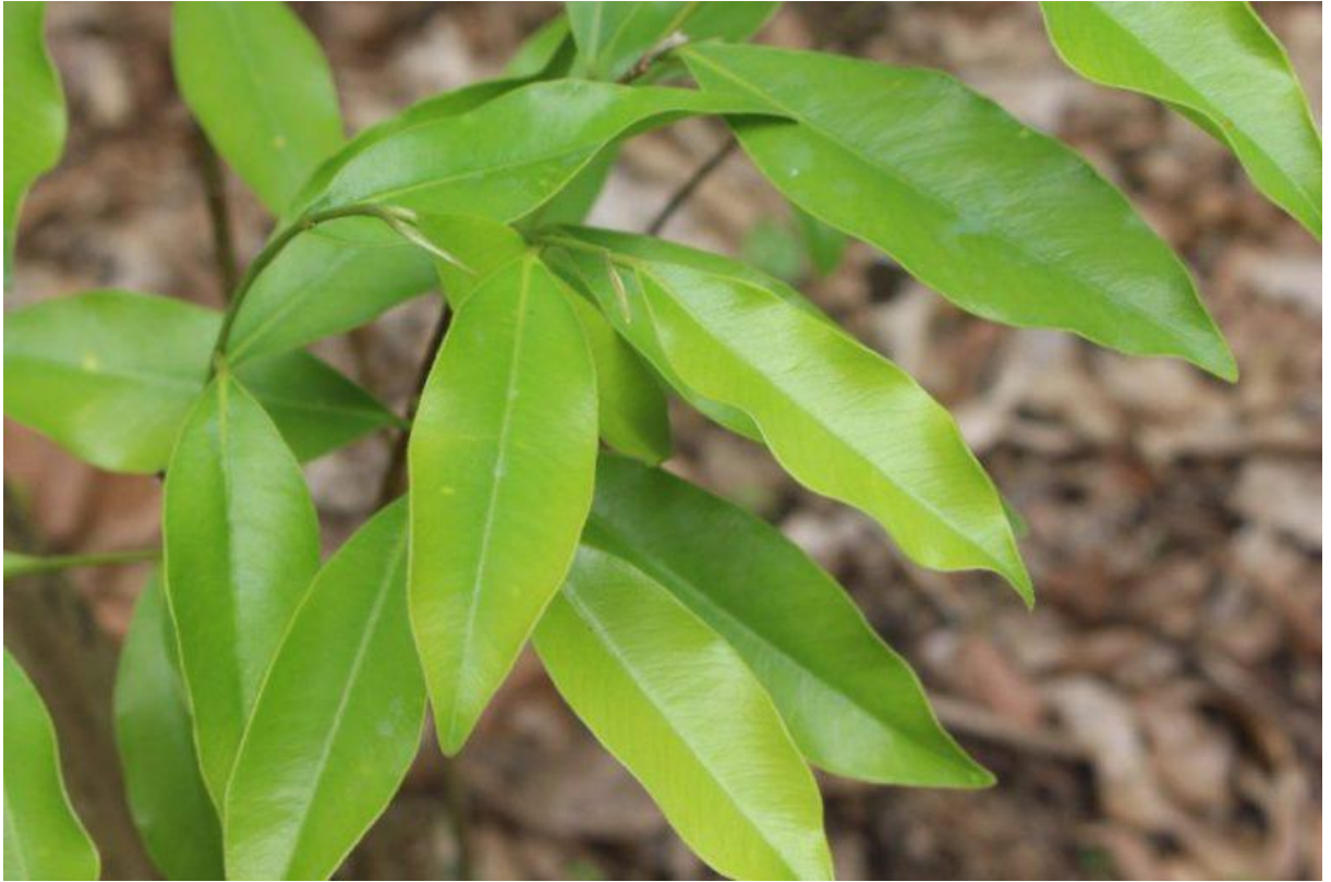
Hình 2: Dó bầu – cành lá