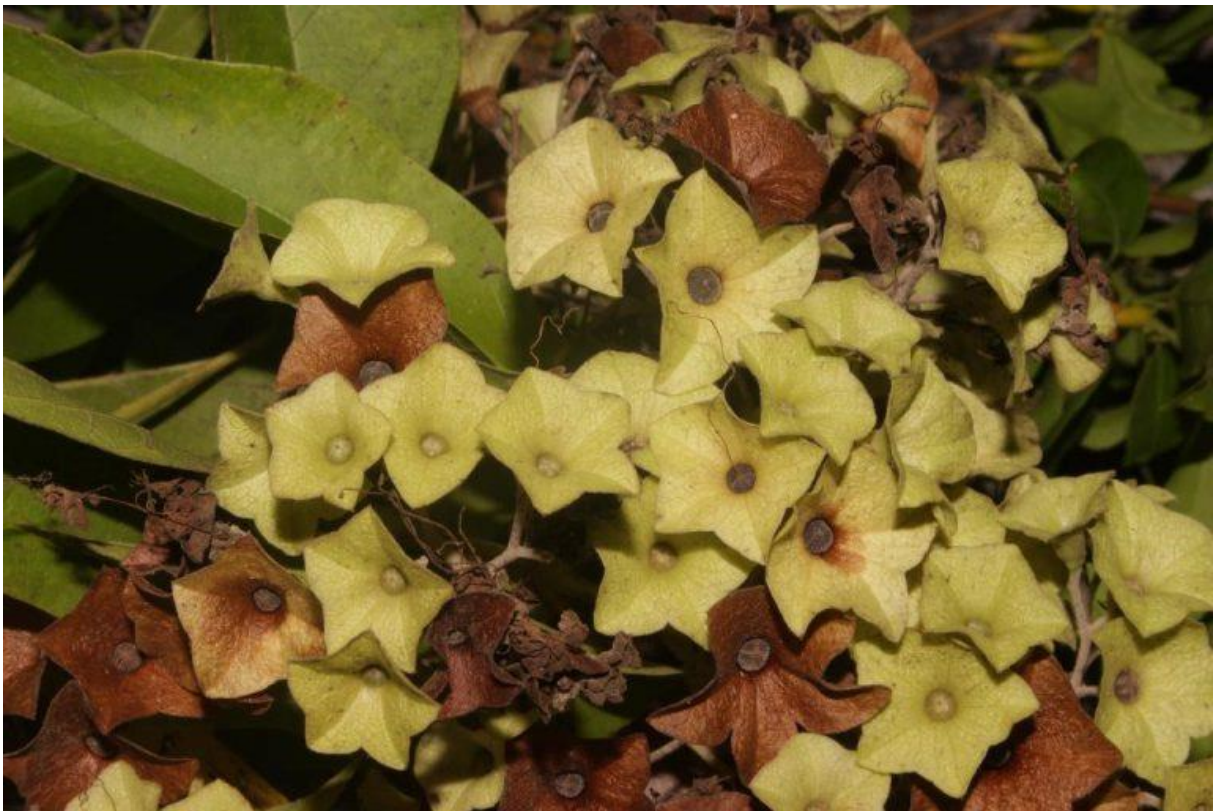
Hình 3: Cà diên – Quả