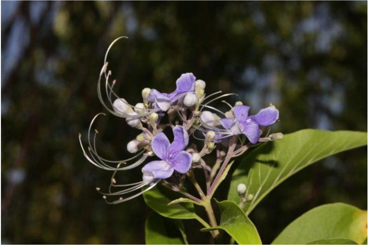
Hình 2: Cà diên – Hoa