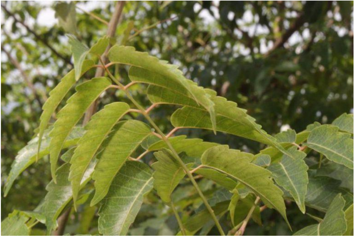
Hình 2: Cây Cóc đá ở Tháp Bà PoNagar – Cành lá