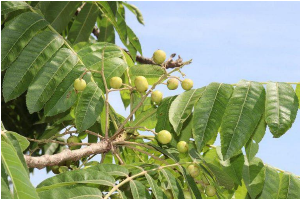
Hình 3: Cóc đá – quả non