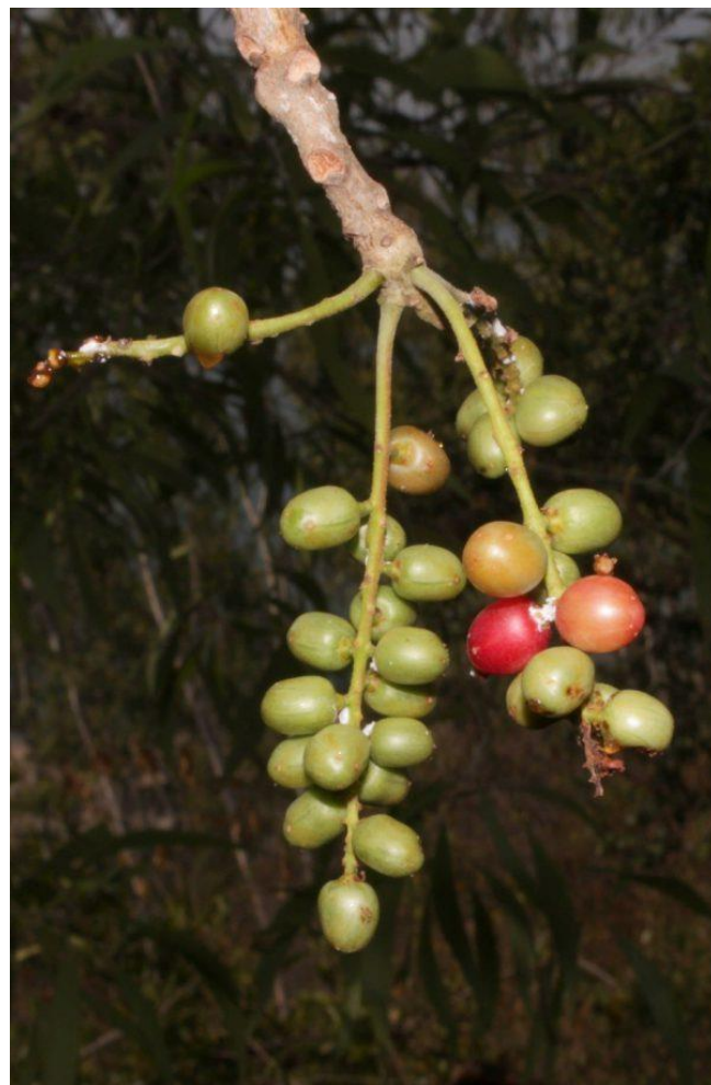
Hình 3: Cóc chuột – chùm quả