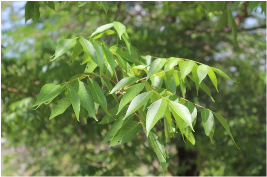
Hình 2: Cóc chuột – cành lá