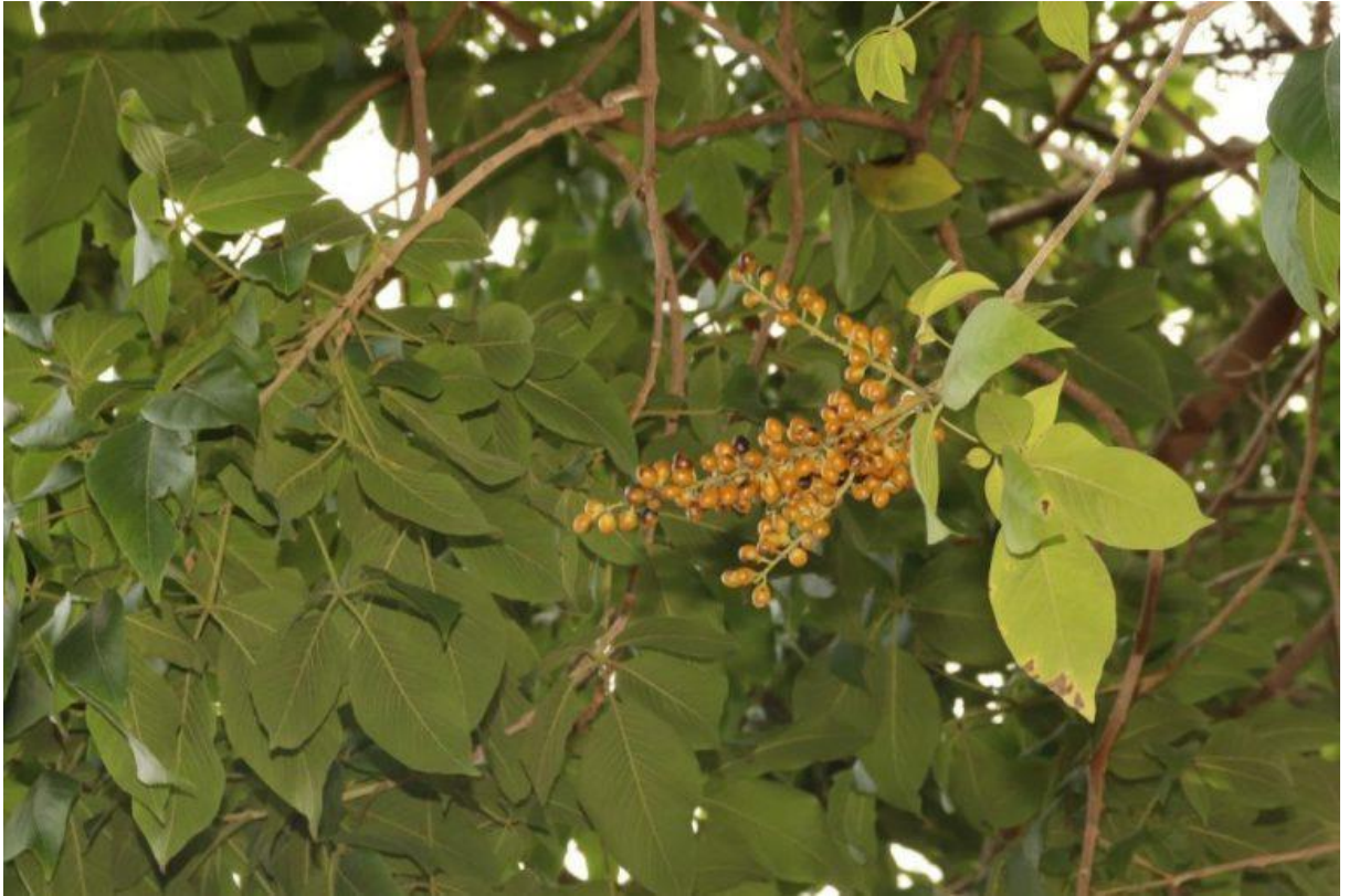
Hình 4: Bình linh – quả