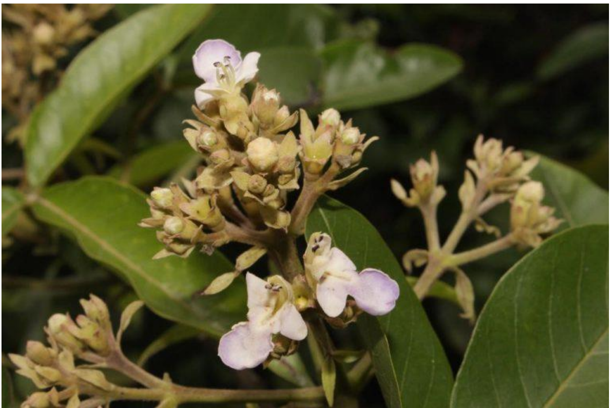
Hình 3: Bành linh – hoa