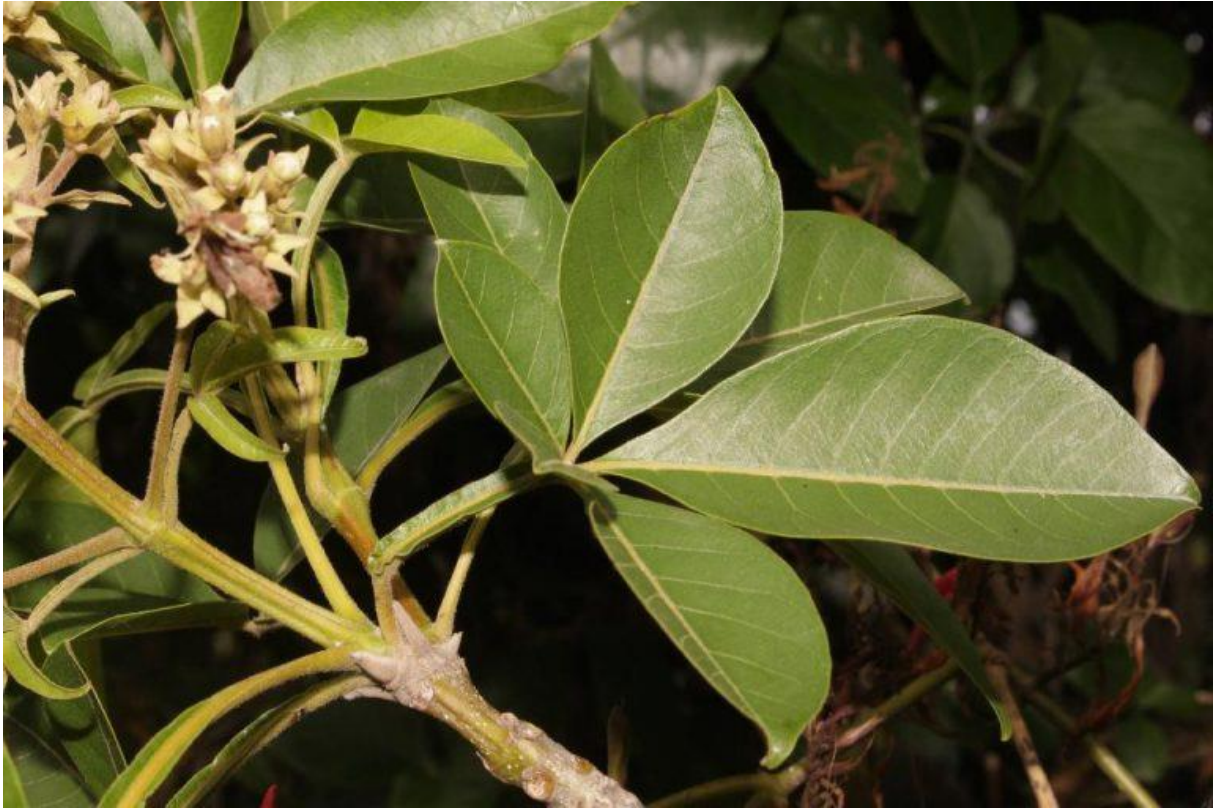
Hình 2: Bành linh – lá