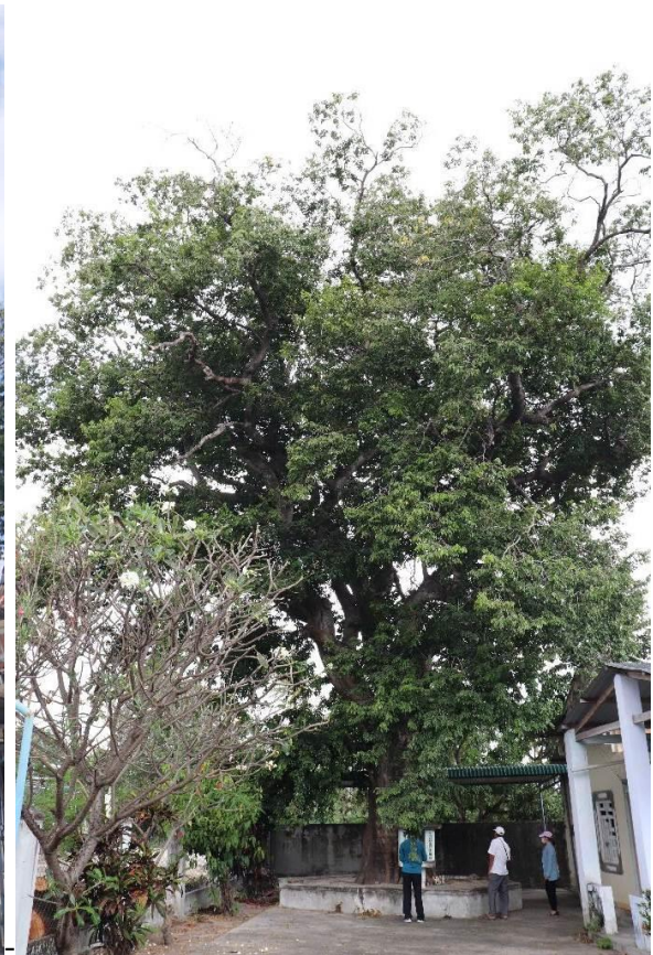
Hình 2&3: Cây Xoay – phía ngoài và trong Đình