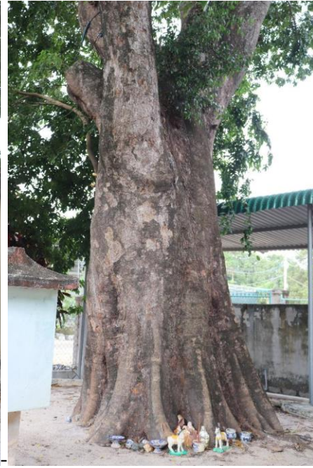
Hình 4&5: Cây Xoay – phần gốc thân (hướng 1&2)