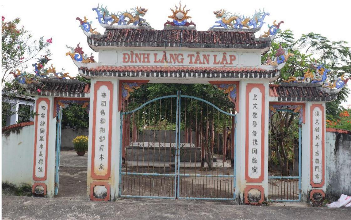
Hình 1: Đình làng Tân Lập