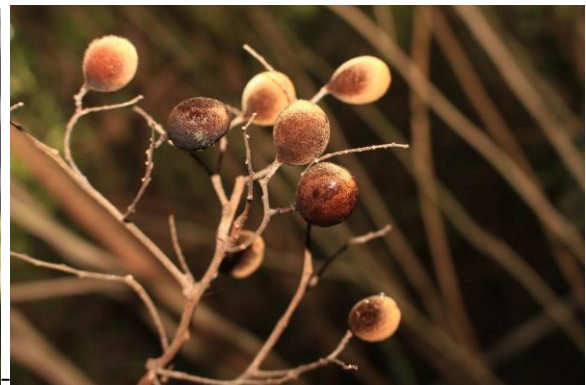
Hình 8&9: Hoa và trái cây Xoay