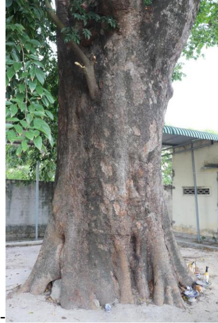
Hình 6&7: Cây Xoay – phần gốc thân (hướng 3&4)