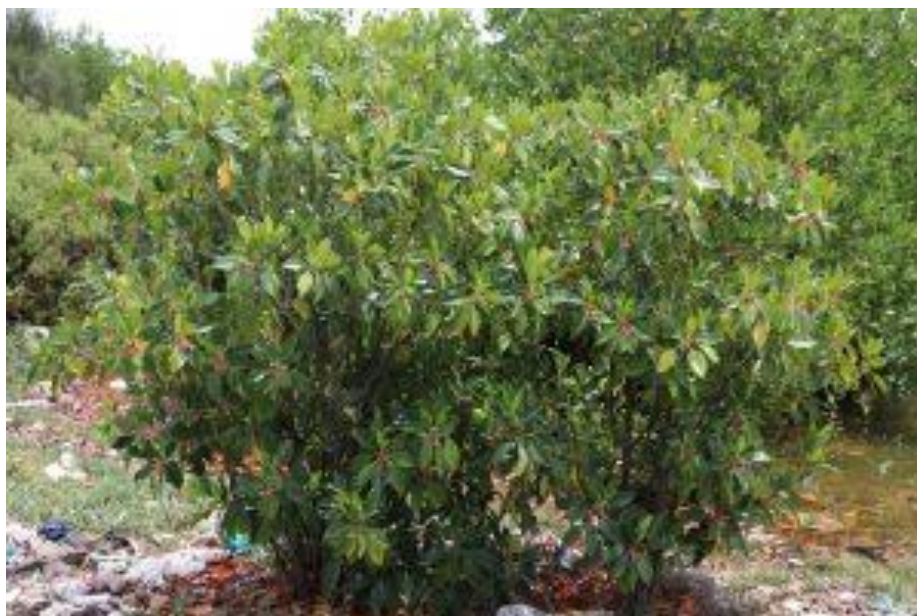
Hình 1: Vẹt dù ( Bruguiera gymnorhiza )