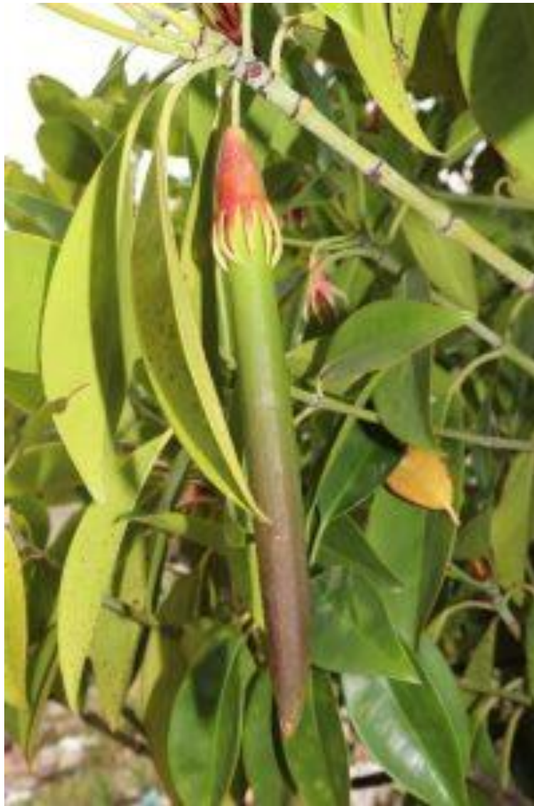
Hình 3: Vẹt dù – Quả & Trụ mầm