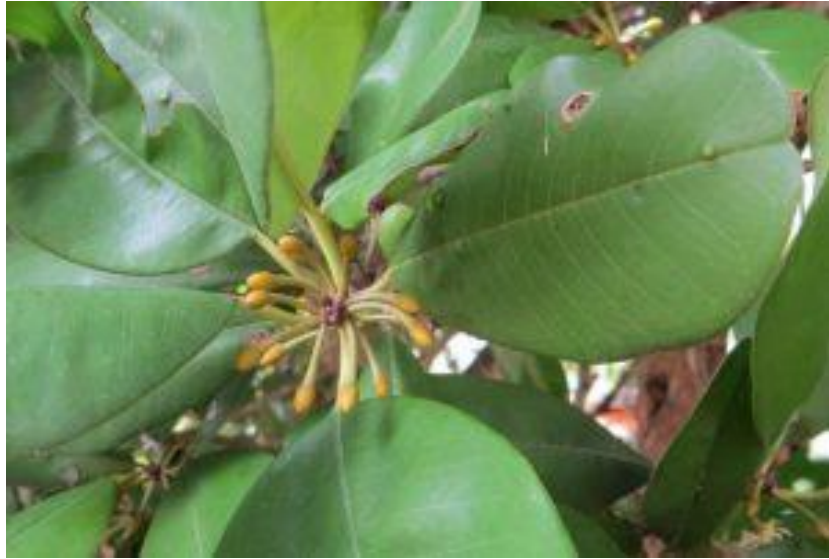
Hình 3: Găng néo – Cụm hoa