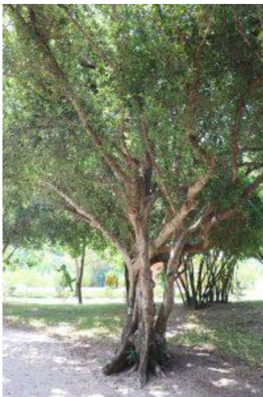
Hình 1: Găng néo ( Manilkara hexandra ) – Thân cây