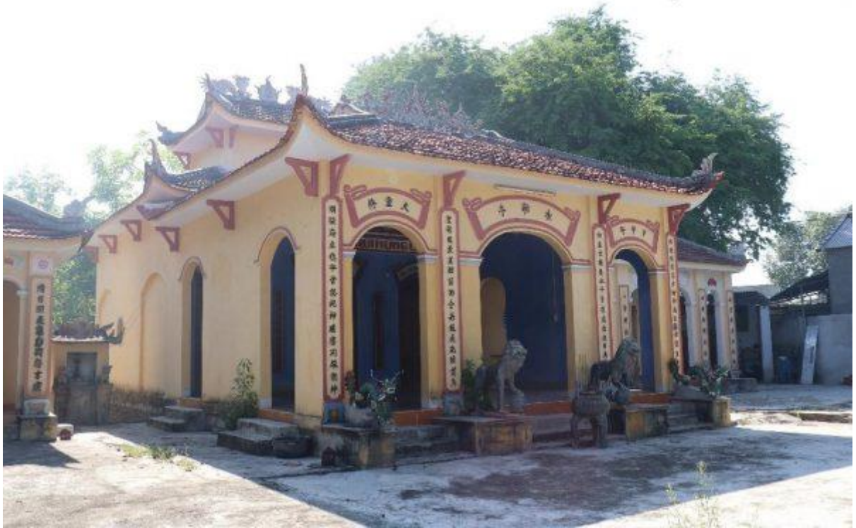
Hình 1: Đình Thủy Triều – cây Me che bóng ở phía sau