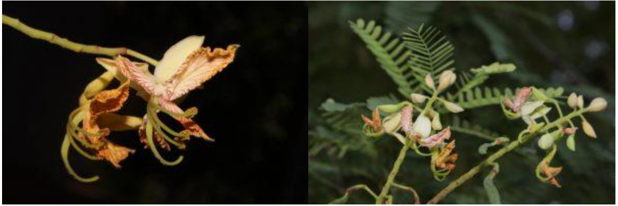
Hình 5 & 6: Hoa & trái non – Cây Me