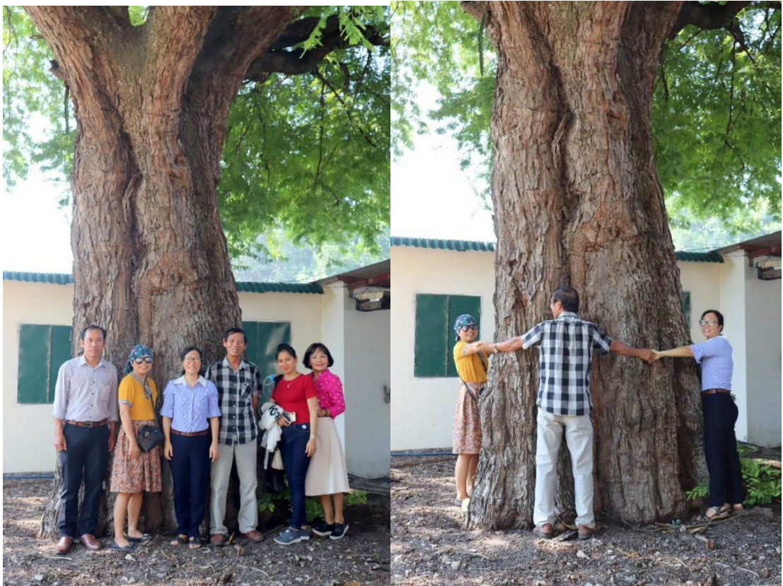
Hình 7 & 8: Khảo sát cây Me tại Đình Thủy Triều

(Hội Bảo vệ TN&MT Khánh Hòa và huyện Cam Lâm)