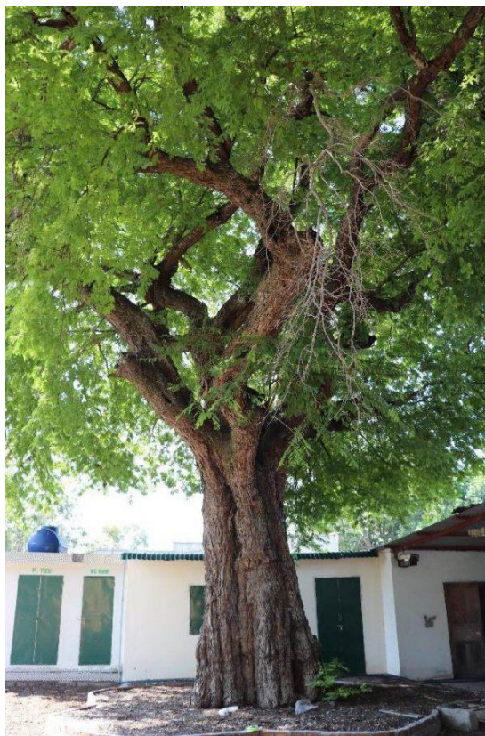
Hình 2: Cây Me – nhìn từ phía trước