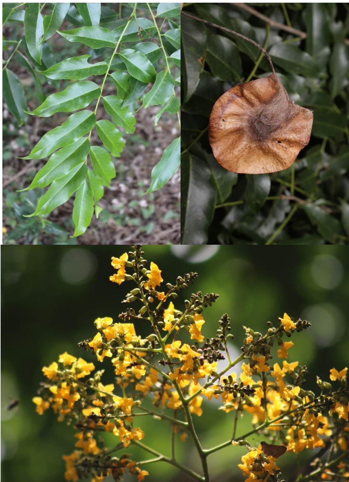
Hình 3: Hóa, lá, quả của cây Hương