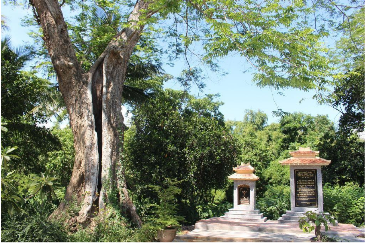
Hình 4: Cây Giáng hương & Bia Cây Di sản